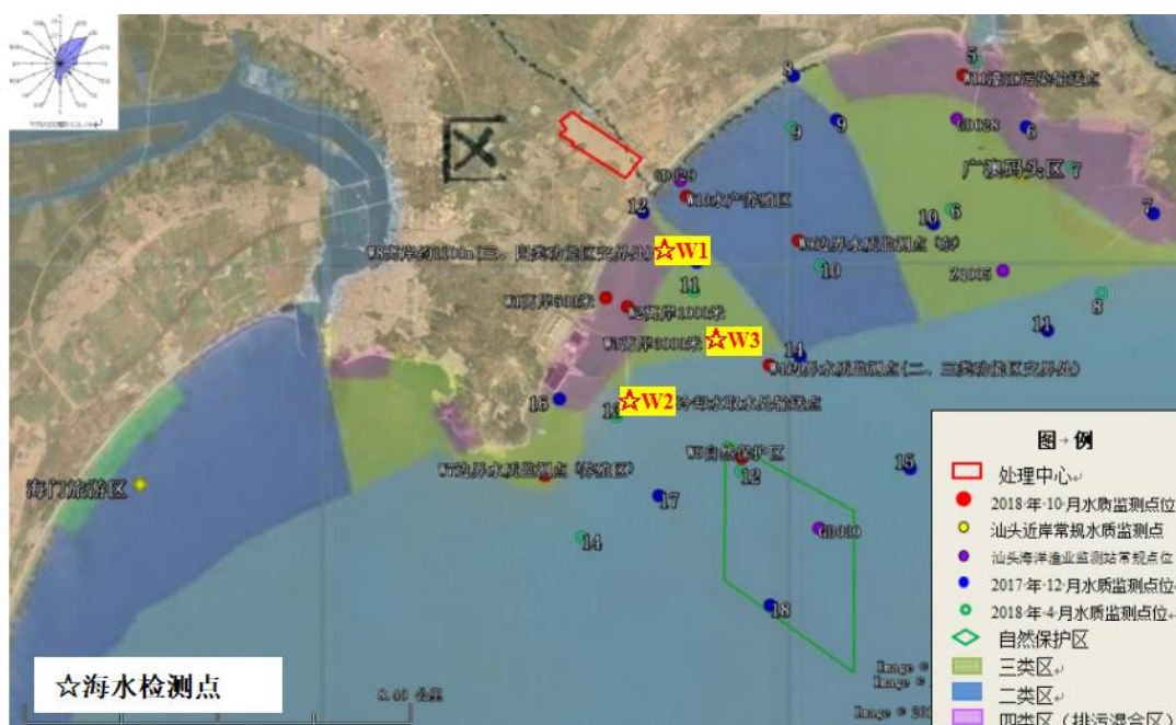
图3.6-1 海水监测点位图

备注1、“ND”表示该项目检测结果低于方法检出限； 2、测点W2执行《海水水质标准》（GB3097-1997）表1第二类限值，测点W1、W3执行《海水水质标准》（GB3097-1997）表1第三类限值； 3、“—”表示执行标准GB3097-1997对该项目不作限值要求； 4、“#”表示该项目为分包项目，分包公司为广东准星检测有限公司，该公司资质认定证书编号：201719120639。