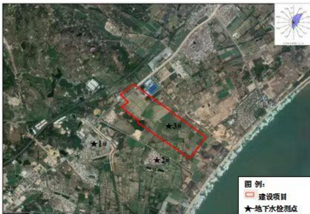
图3.6-3地下水监测点位图