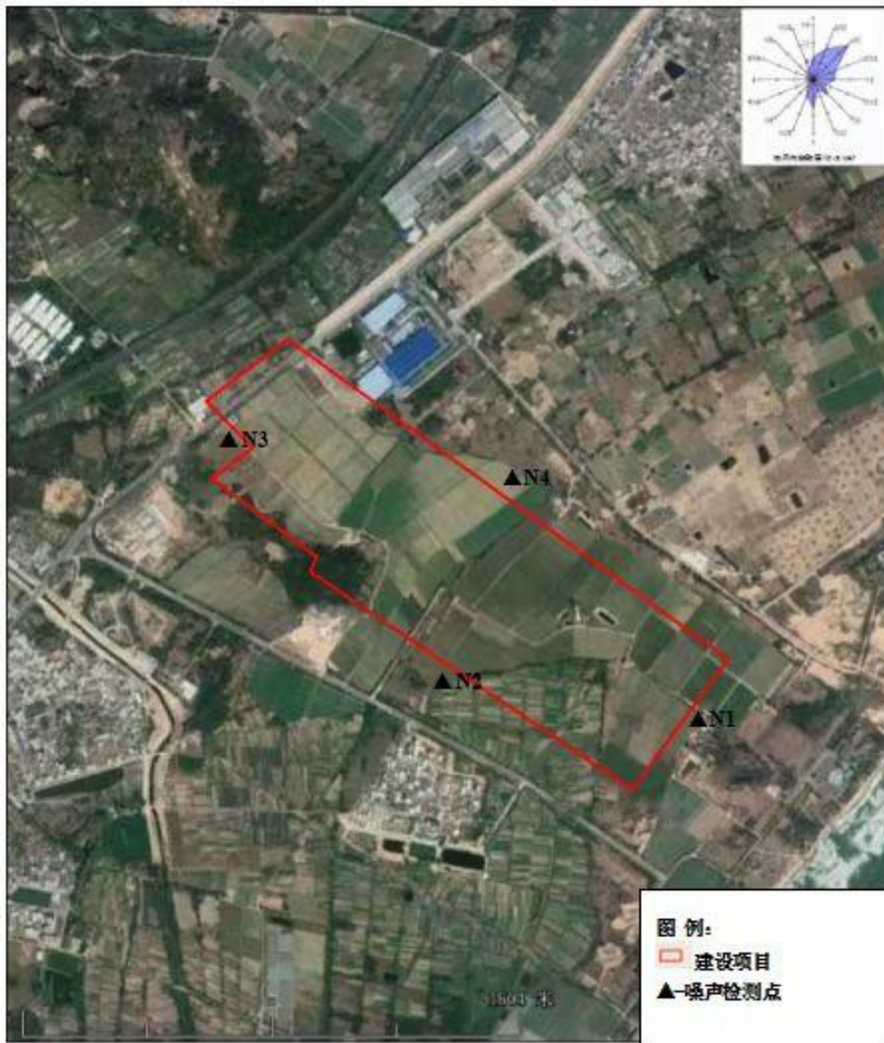
图3.6-4 环境噪声监测点位图