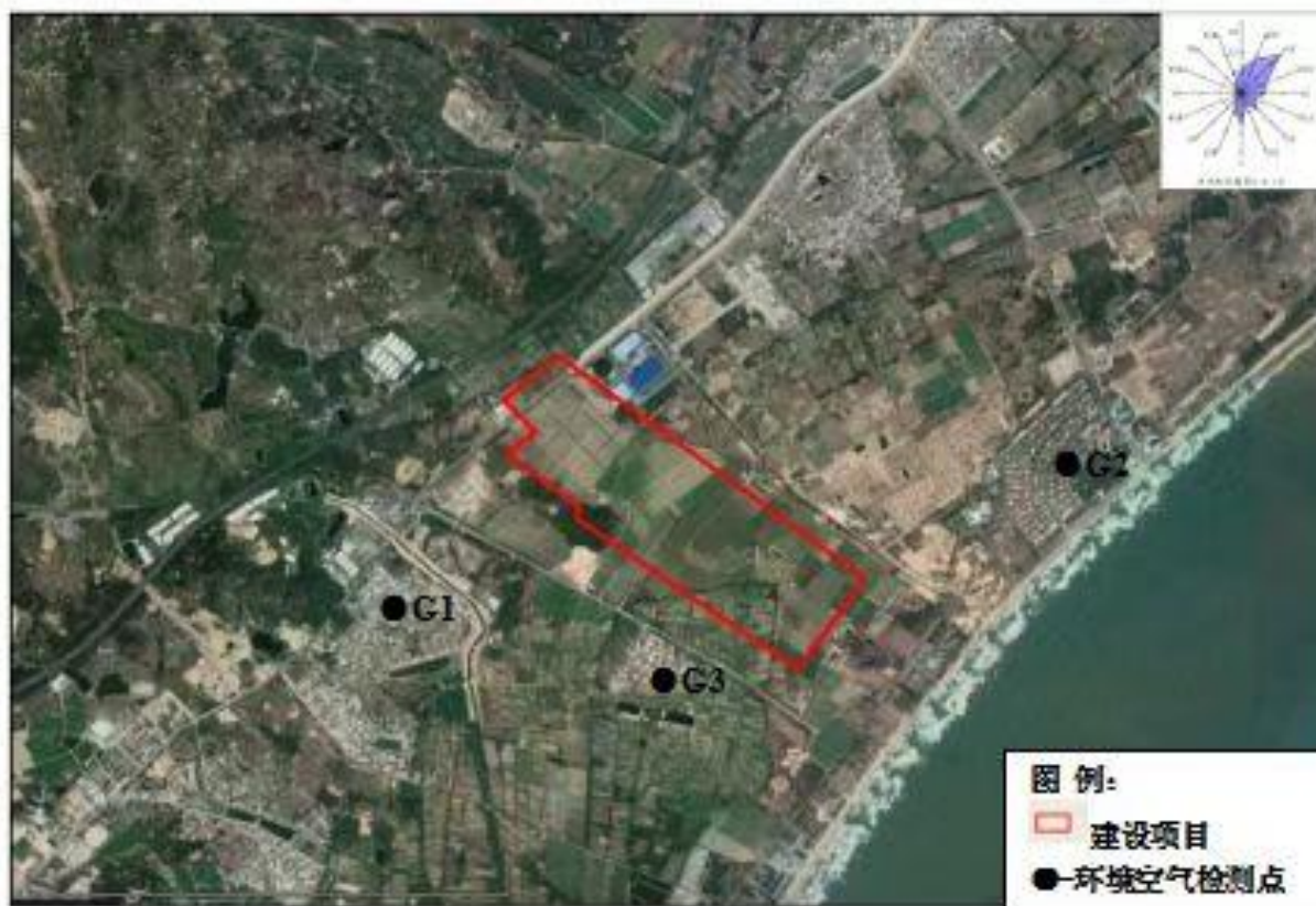
图3.6-2 环境空气监测点位图