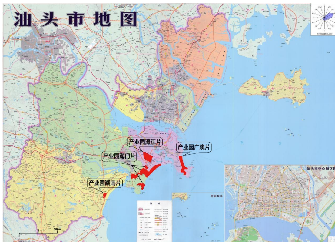
图 2.2-1 海门片区与汕头市产业转移园的相互关系